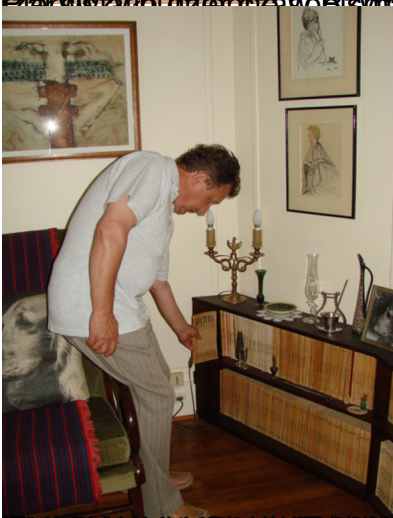
Wnętrze domu w Warszawie, w którym mieszkał autor książki „Kultura w Warszawie 1945-1956”