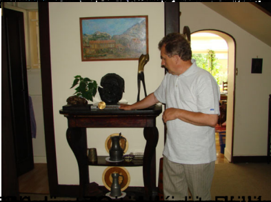
Wnętrze domu w Warszawie, w którym mieszkał autor książki „Kultura w Warszawie 1945-1956”