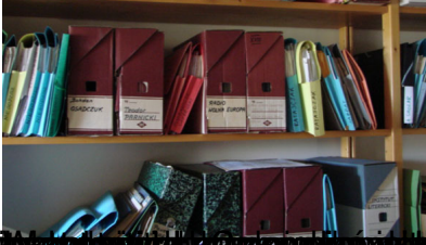
Wnętrze biblioteki w domu w Warszawie, w której znajduje się kolekcja książek i dokumentów z czasów powojennej Warszawy